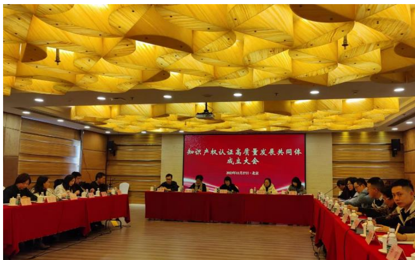
2023 年 11 月公司参加知识产权高质量发展共同体成立大会

续跟踪 ISO 56005:2020 《创新管理 知识产权管理指南》及其能力评价业务推广进展，公司于 2023 年 10 月加入了知识产权高质量发展共同体，具备了开展 ISO 56005 创新与知识产权管理等级评价业务资质，公司已完成评价人员培训并获得资质，公司已具备开展相关项目的条件，正在进行项目推广。