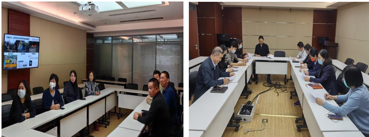
2023 年公司多次组织党建学习活动

上报，并通过党员 E 先锋、支部工作手册完成各工作的记录填报。一年来，完成了支部换届；参与各项党建宣传工作，包括三月学雷锋、党的二十大金句诵读、党支部轮训等各项学习活动 19 项，撰写各类计划、总结、报告、自查清单等 22 份。