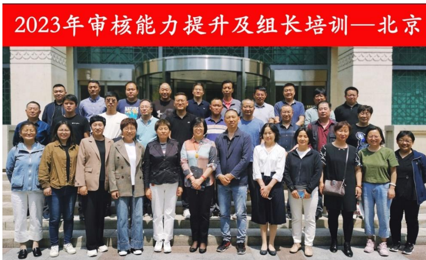
2023 年公司在北京组织审核能力提升及组长培训

YYT 转版、中石油 HSE 转版、审核组长能力提升培训，配合技术部完成新产品碳管理体系审核员培训等专项培训。2023 年 4 月公司采取线下召开审核员大会，参会审核员达到 300 多人次，效果显著。公司根据认证认可协会开展的继续教育课程备案方案，年内组织审核员编制 2 个课程并上线，效果良好。