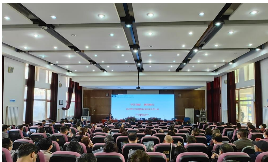
2023 年 4 月公司采取线下召开审核员大会

四是扩展审核员专业能力，定期见证及加强日常监控。2023 年，公司根据不同区域项目对审核员专业的需求，完善能力评价准则，主动与审核员沟通确认，评定审核员专业增长 10%，为公司业务发展提供资源保障。公司严格执行审核员见证计划，全年见证率为 92%。