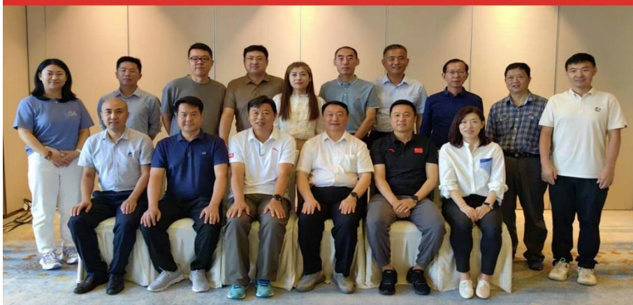
2023年9月在西安组织“获证组织高层管理者2023年度西安高峰论坛”