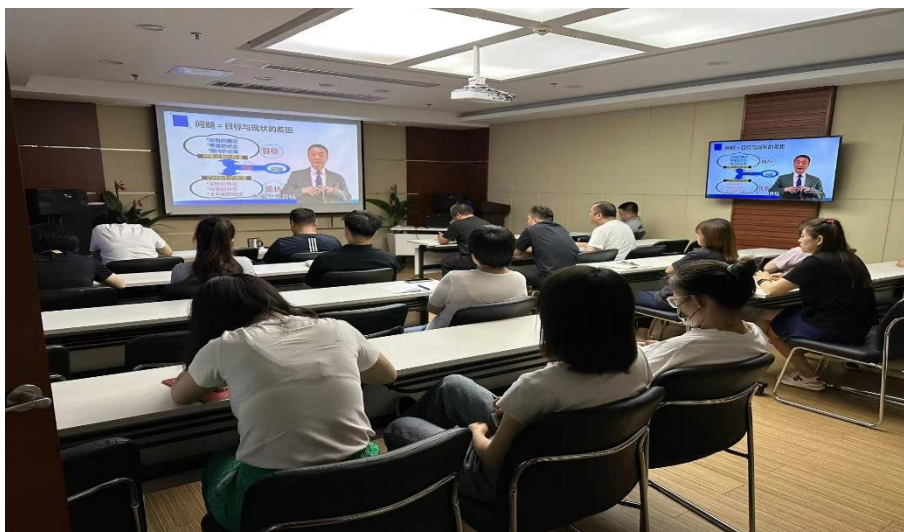
2023 年 7 月公司组织管理人员职业素养培训