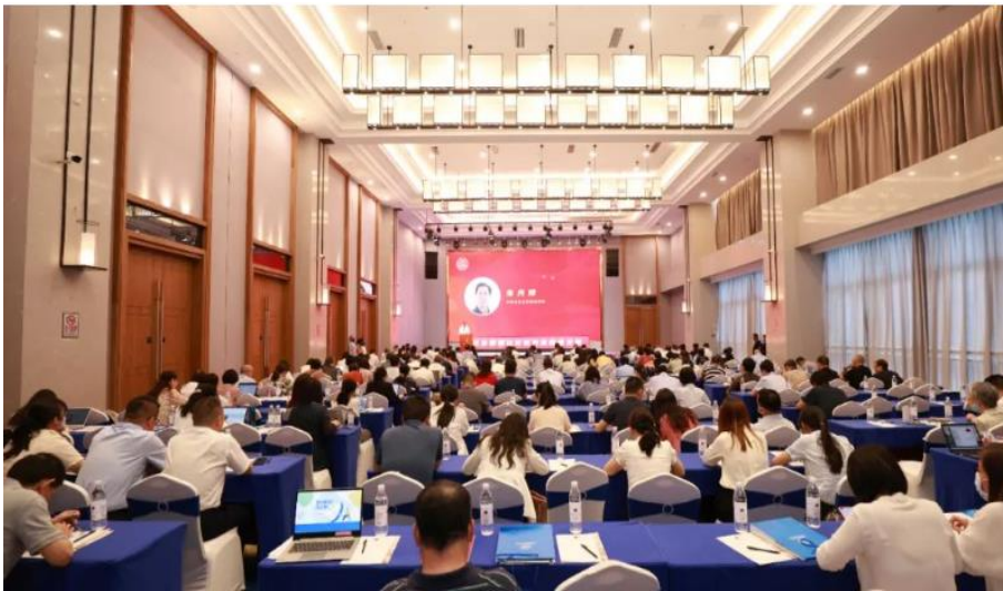
2023 年 5 月公司参加南宁举行的 2023 年认证技术提升周活动

2023 年良好案例及技术论文交流活动中，公司共征集 72 份案例及 46 技术论文，经内部初评，推选 7 份良好案例和 4 份认证技术交流论文上报至 CCAA，最终 1 个案例入选 CCAA 良好案例，2 篇论文入选 CCAA 优秀论文（书面交流）；2023 年 6 月 1 日，我公司人员参加 CCAA 南宁认证技术提升周活动，现场交流评议良好案例，同时完成 CCAA 年度优秀技术论文培训微视频制作。