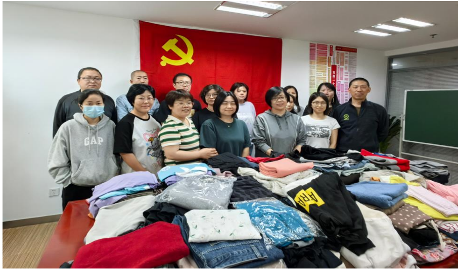
2023 年公司组织员工志愿捐献活动