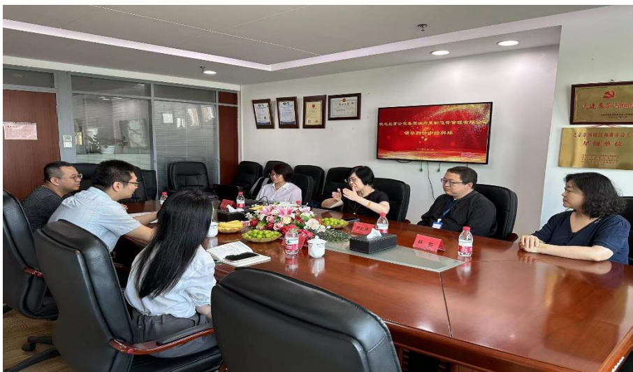
2023年7月公司与大客户进行面对面交流

2023年公司继续加大新产品推广力度，新产品开发过程市场人员全程参与，及时制定市场政策及新产品宣传资料，并通过各分支机构、网络等渠道进行宣传。2023年公司在碳核查、碳足迹项目上有所突破。