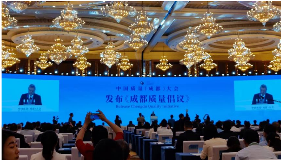
2023年9月公司受邀参加中国质量（成都）大会

2023年，公司持续落实市场监管总局组织开展的认证机构“双随机、一公开”检查，向审核员、分支机构及获证客户通告双随机检查要求，积极配合完成双随机检查工作，对检查提出问题积极制定措施予以改进。