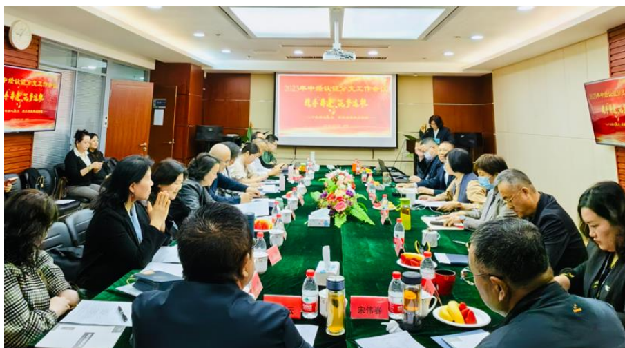
2023 年度分支机构工作会议

2023 年，11 家分支机构能够遵守公司的各项管理要求，未出现违规行为，分支机构的整体业绩稳步提升，部分分支机构在新品领域取得了较好的业绩。