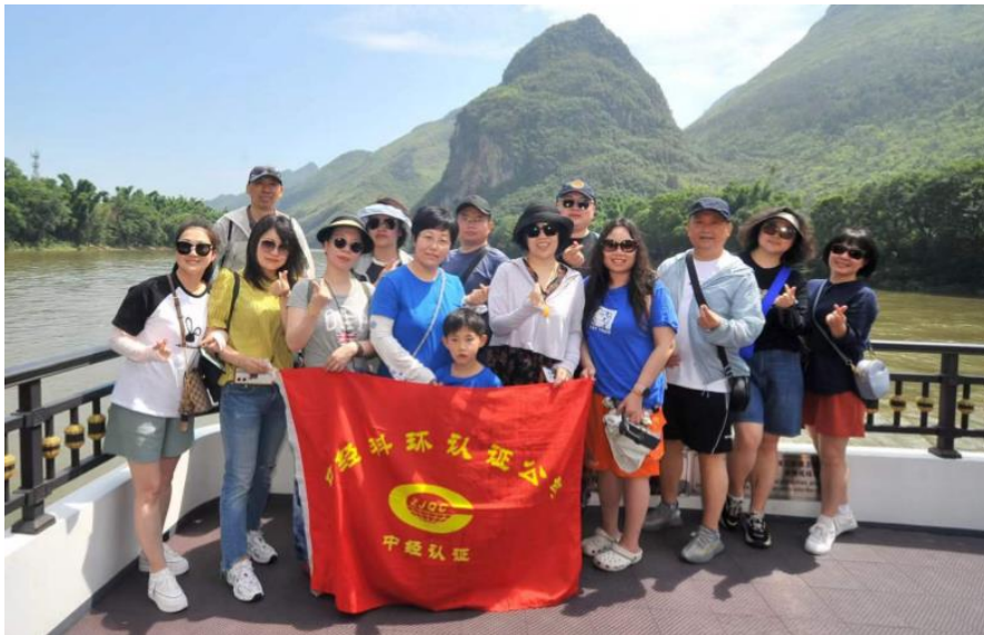
2023年5-6月，公司组织优秀员工出游。

2023年公司继续加强企业文化建设，年初设计更新了公司企业文化墙固定模块内容，更新文化活动版块，日常按月更新业务指标完成数据内部展示。2023年5-6月间，作为奖励，组织优秀员工出游。