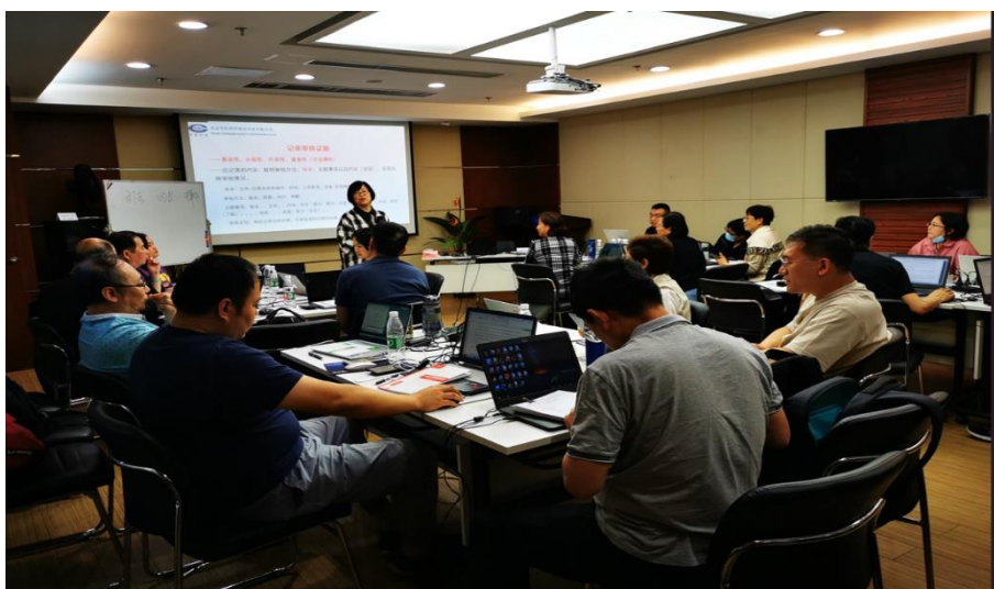
2023 年 5 月公司在北京举行审核员能力培训

公司人员招聘本着公平、开放的原则，广泛面向社会招聘人才。新员工入职培训按要求实现 100%覆盖，内部集中培训按照年度计划执行，并适当调整，采用线上线下相结合方式，内容以专业知识与职业素养相结合，保证了内部培训的频次和参与度，2023 年公司共组织各类主题的集中培训 13 项，共 16 次。